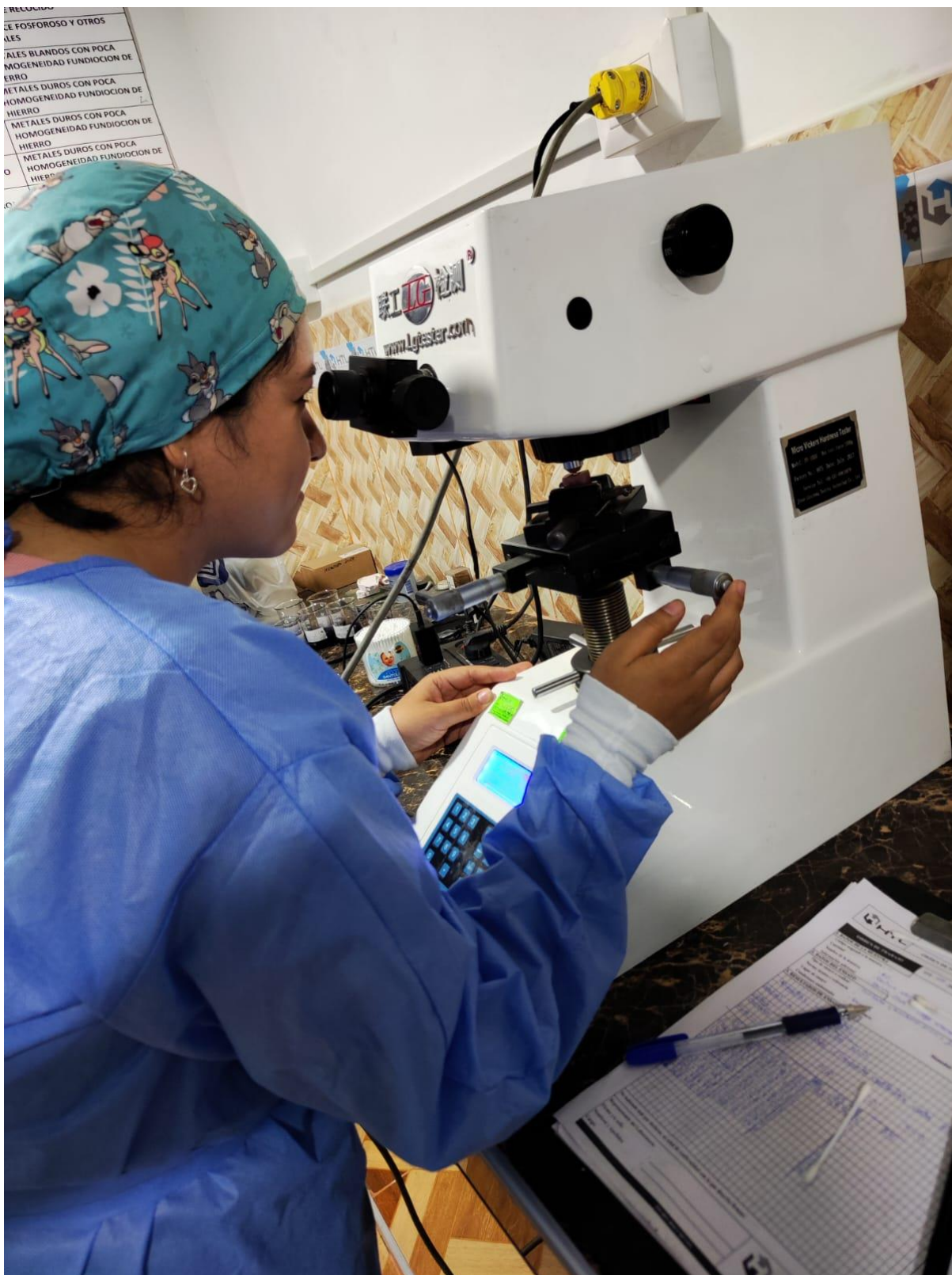
Observación de la microdureza