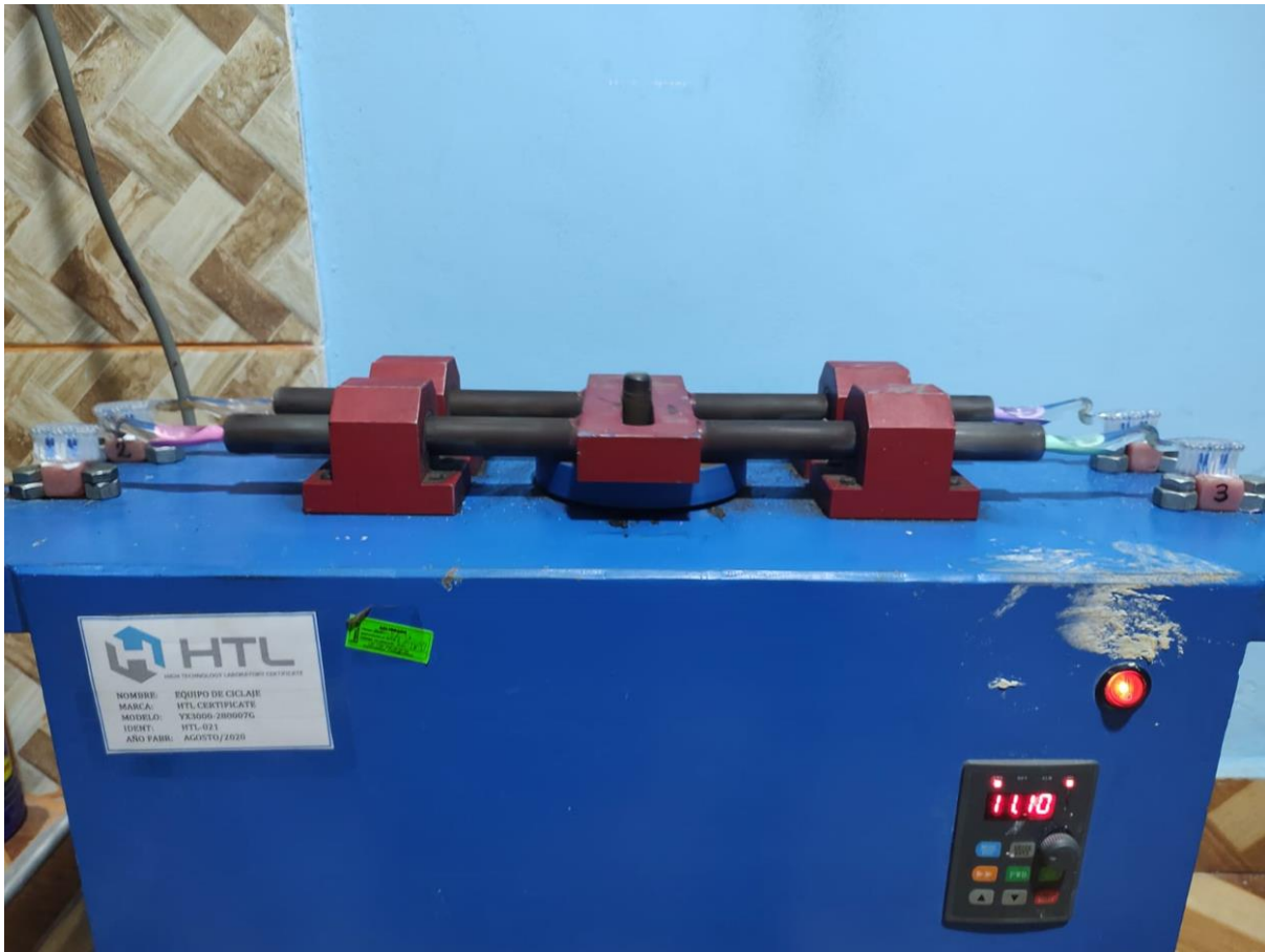
Ciclos de cepillado sobre los especímenes