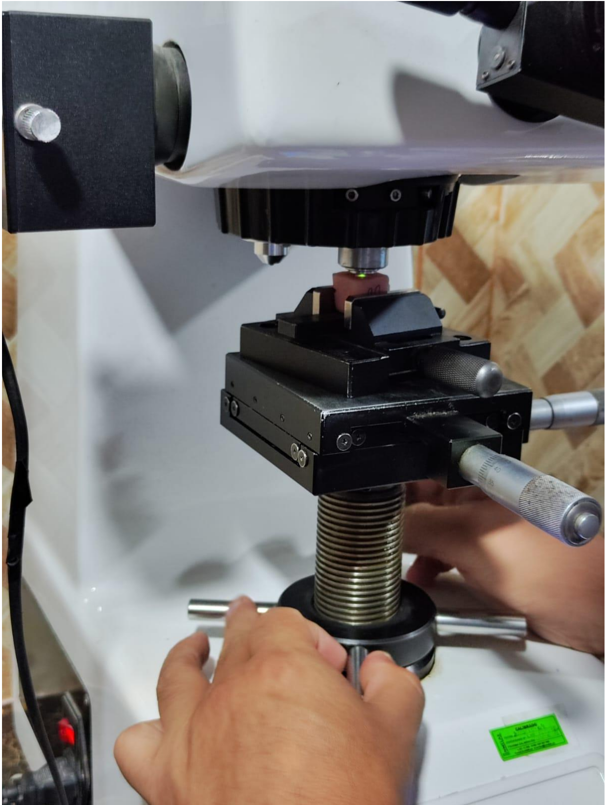
Ajuste del espécimen en el microdurómetro