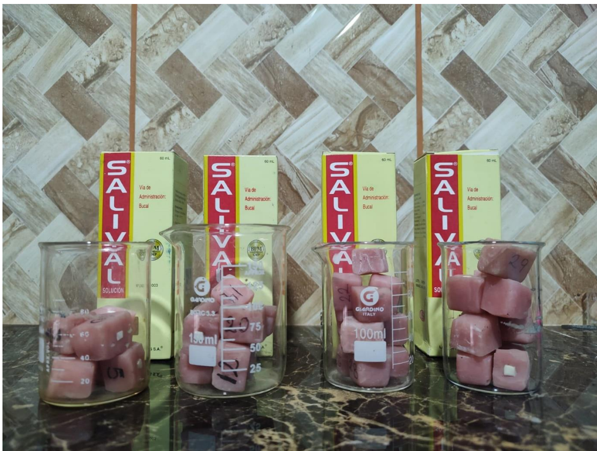
Grupos divididos aleatoriamente