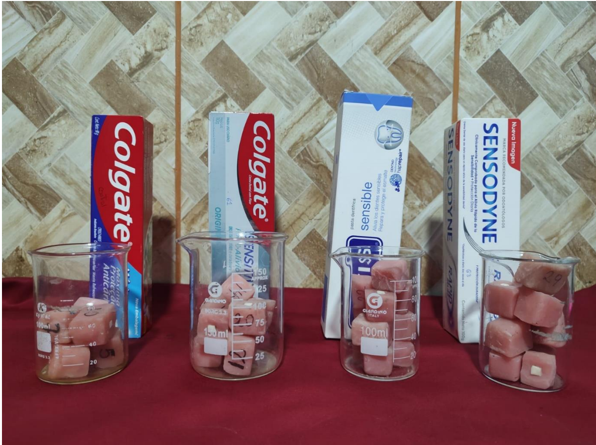
Pastas dentales que se evaluaron